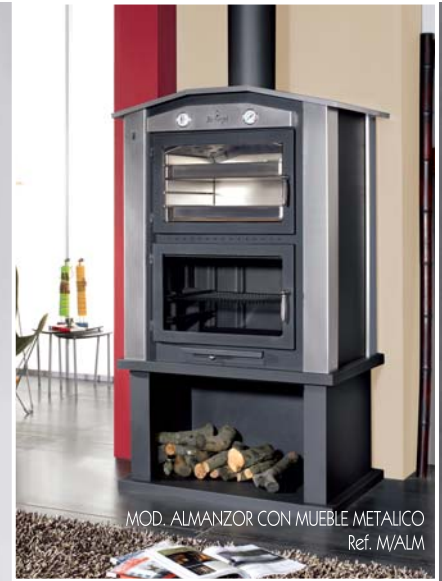
MOD. ALMANZOR CON MUEBLE METALICO Ref. M/ALM