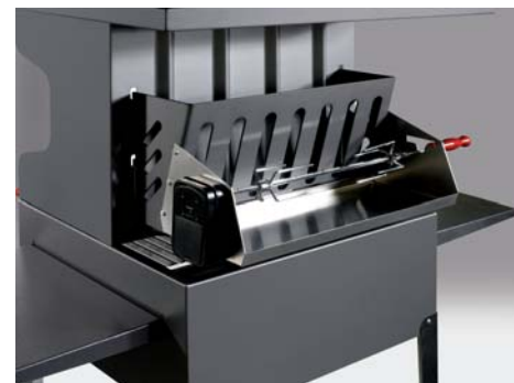
detalle asador automático en trasera